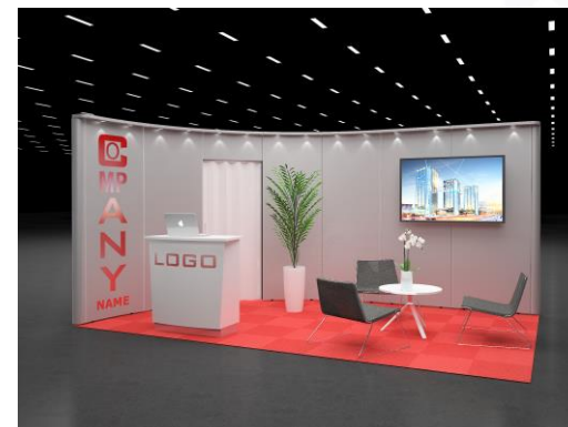
OBS! Bilden är extrautrustad med teknik, grafiskt tryck, och växt